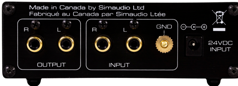
Figure 1: Panneau arrière du MOON 110LP v2